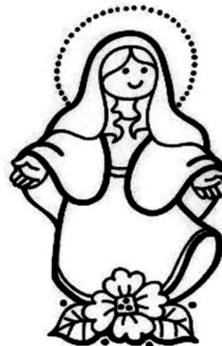
La Medalla Milagrosa