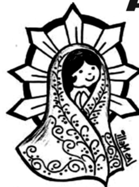
Nuestra Señora de Luján