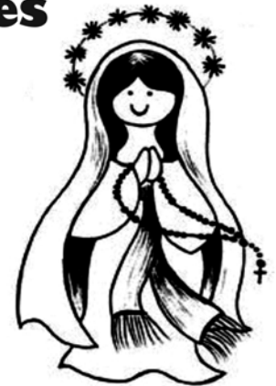
Nuestra Señora de Lourdes