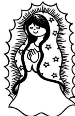
Nuestra Señora de Guadalupe